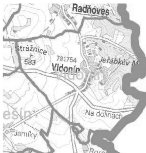
Obrázek 2 a 3: výřez ze ZÚR Kraje Vysočina – Výkres Oblasti se shodným krajinným typem a Výkres ploch a koridorů, včetně územního systému ekologické stability.